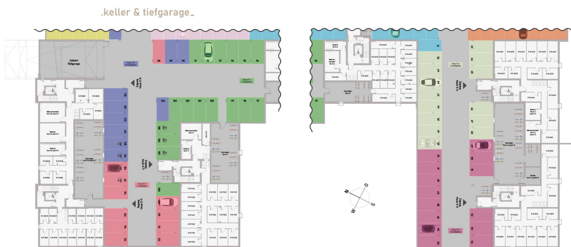
Grundriss Keller Tiefgarage Teil 2

Kaufpreis: 339.900,00 EUR Wohnfläche: 64,16 m 2 Zimmer: 2 Zimmer Anbieter-ID: KB00010/G2/E2/Eh3