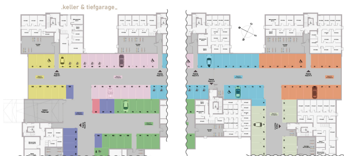
Grundriss Keller Tiefgarage Teil 1

Kaufpreis: 339.900,00 EUR Wohnfläche: 64,16 m 2 Zimmer: 2 Zimmer Anbieter-ID: KB00010/G2/E2/Eh3