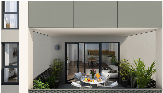
Visu Terrasse 5-2