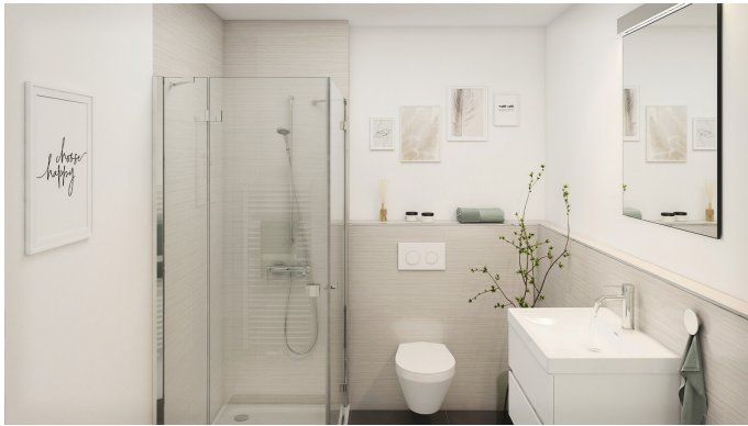
Visu Bad 5-2

Kaufpreis: 334.900,00 EUR Wohnfläche: 62,64 m 2 Zimmer: 2 Zimmer Anbieter-ID: KB00010/G2/E2/Eh2