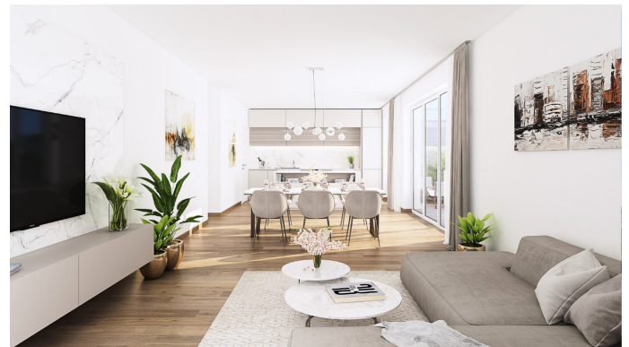
Visu Wohnen 5-2