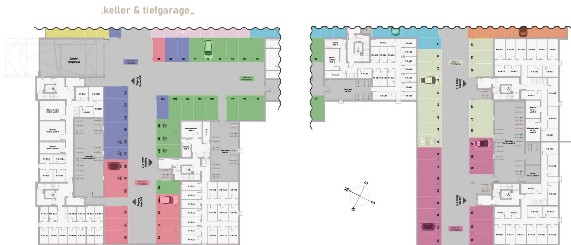
Grundriss Keller Tiefgarage Teil 2

Kaufpreis: 334.900,00 EUR Wohnfläche: 62,64 m 2 Zimmer: 2 Zimmer Anbieter-ID: KB00010/G2/E2/Eh2