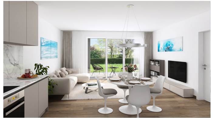
Visu Essen 5-2